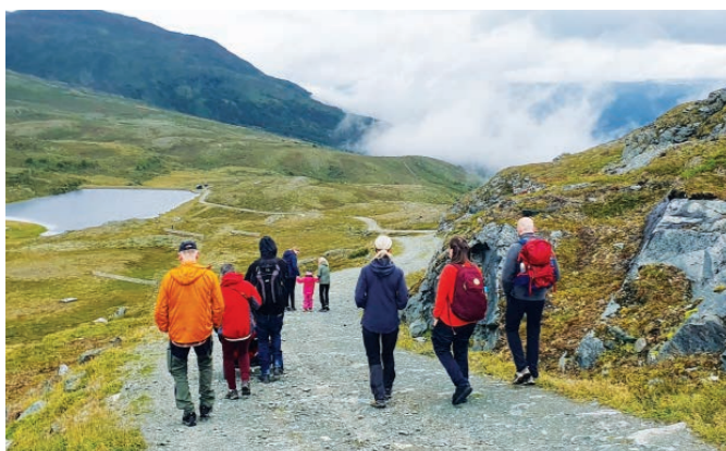
Helgetur til Oppdal med turer i nydelig natur og gode samtaler.

FFP Trøndelag inviterte også i år små og store pårørende med på helgetur til Oppdal. Det var en fin helg med turer i skog og fjell, gondoltur, grilling, kortspill og hyggelige samlinger med gode samtaler. Tusen takk til Bufdir og Torstein Erbos Gavefond for støtte til turen.