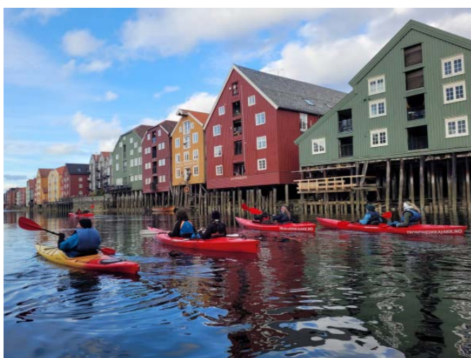
FFP Trøndelag inviterte pårørende med på kajakttur på Nidelva i nydelig maivær.