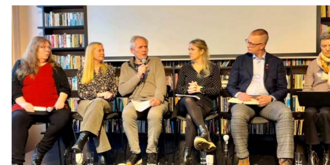
FFP deltok i debatt om soningsforhold i norske fengsler med fokus på situasjonen for innsatte med psykiske lidelser. FFP tok opp betydningen av kontakt med pårørende når innsatte er psykisk syke, suicidale eller er isolert