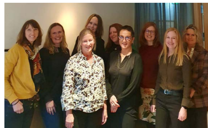
FFP deltar i referansegruppa i forskningsprosjektet som skal se på sammenhengen mellom negative opplevelser i barndommen og barns livsmestring.

FFP har bidratt med innspill i et større, tverrfaglig forskningsprosjekt om barn med foreldre i fengsel gjennom deltakelse i en referansegruppe, samt at vi har bidratt med rekruttering av informanter til prosjektet. Prosjektet er støttet av Norges forskningsråd, og gjennomføres av forskere ved KRUS, VID, NORCE og Universitetet i Miami. Gjennom prosjektet skal de se på forholdet mellom ulike negative opplevelser i barndommen, blant annet fengsling av foreldre, og barns livsmestring og levekår knyttet til helse og utdanning. Prosjektet har også som målsetting å avdekke faktorer som kan virke beskyttende og fremme positiv utvikling hos disse barna.