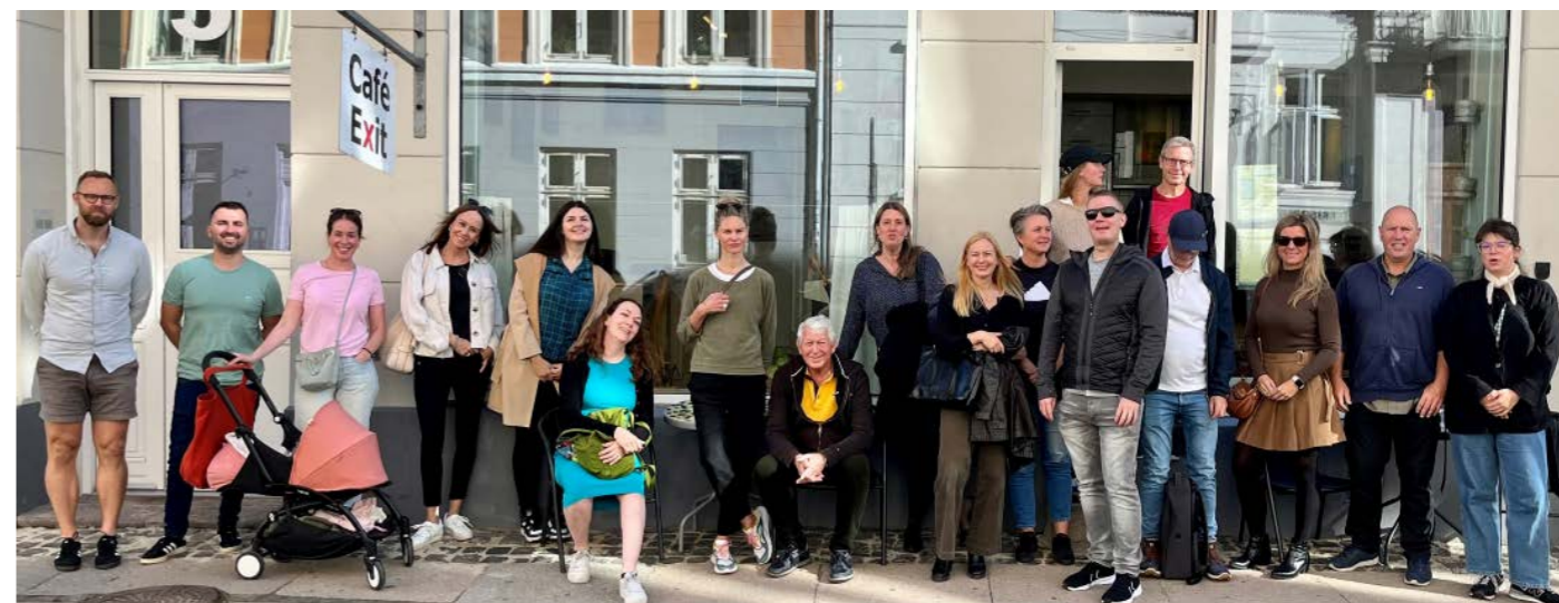
FFP fikk være med da helseavdelingen i Oslo fengsel reiste på studietur til København sammen med Helsedirektoratet.

Helseavdelingen i Oslo fengsel har satt pårørende på dagsorden i forbindelse med at det kom en ny veileder for fengselshelsetjenesten med et eget kapittel om inkludering av og støtte til pårørende. Helseavdelingen har etablert en referansegruppe bestående av pårørende, og FFP har deltatt med innspill og vår erfaring på flere møter med helseavdelingen og fengselet. Sammen med representanter fra Helsedirektoratet deltok FFP også på en studietur helseavdelingen arrangerte til København, der vi blant annet besøkte ulike organisasjoner og tiltak for å se hvordan de jobbet.