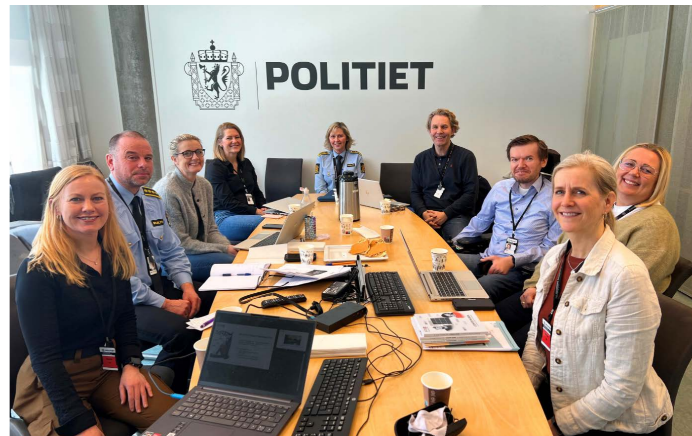
FFP presenterte funn fra undersøkelsen om pårørendes opplevelse ved arrestasjon og varetekt for Trøndelag politidistrikt.

2023 var siste år av det toårige prosjektet Pårørendes situasjon ved arrestasjon og varetekt . Første prosjektår resulterte i en forskningsrapport basert på en undersøkelse gjennomført av Sosiologisk Poliklinikk i Trondheim. Undersøkelsen viste at det er tilfeldig hvordan pårørende møtes av politiet under pågrep og varetekt av et familiemedlem, at det er lite fokus på pårørende i politiutdanningen, og at det mangler rutiner hos politiet når det gjelder å ivareta og å gi informasjon til pårørende når noen arresteres eller varetektsfengsles. I 2023 har FFP informert om kunnskap fra undersøkelsen til hjelpeapparatet, kriminalomsorgen og politiet gjennom en lang rekke foredrag, samt i møter og annet samarbeid. Målet er å påvirke til å etablere bedre rutiner hos politiet for å ivareta pårørende i denne sårbare fasen.