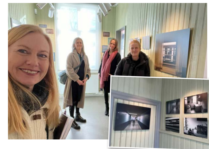
Hyggelig for ansatte i FFP å besøke Justismuseet å se FFPs utstilling «Bak murene – sett med barn av innsattes øyne» med bilder fra ungdom i FFP Ung.

Også i 2023 har FFPs utstilling Bak murene – sett med barn av innsattes øyne vært vist på Justismuseet i Trondheim. Utstillingen består av bilder tatt av tre ungdommer på 15 og 16 år med en forelder i fengsel på Ullersmo fengsel våren 2015. Justismuseet er Norges nasjonale museum for justissektoren. FFPs utstilling har vært vist på museet siden 2021.