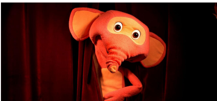
Padletur på Nidelven og Fantorangen på teater er blant tilbudene dette semesteret. (Foto av Fantorangen: Lars Opstad)