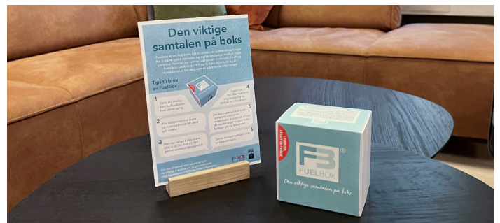
Vi håper pårørende og innsatte vil benytte fuelboxen under besøkene i fengsel, og at den vil være til hjelp for mange!

Fuelboxen er utviklet spesielt for barn, unge og voksne pårørende og innsatte i et samarbeid mellom FFP og Kirkens Bymisjon. Vi har fått mange positive tilbakemeldinger både fra pårørende og fra samarbeidspartnere som har benyttet den i sitt arbeid. Fuelboxen kan bestilles gratis via FFPs nettsider.