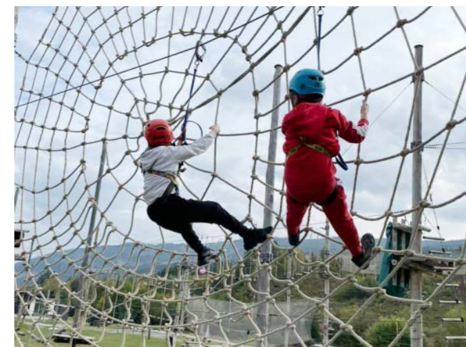
Utfordrende og morsomt i klatreparken i Ål!

I september arrangerte FFP Ung helgetur til Topcamp i Ål i Hallingdal for barn, unge og familier. Alle familiene bodde i egne hytter med fantastisk beliggenhet rett ved Hallingdalselva. Vi hadde en super helg med flere morsomme aktiviteter og opplevelser, som klatring i Høyt og Lavt klatrepark, Lekeland, Eventyrgolf og tur på området. På kveldstid spilte vi kahoot, og barna underholdt med sang og dans. Det var god stemning blant både store og små, og mange sa de skulle ønske turen varte enda lenger. I tillegg til at vi hadde mye moro og fine opplevelser sammen, ga turen rom for de pårørende til å kunne snakke sammen om problemstillinger de har, både med hverandre og med FFPs rådgivere. Slike turer er verdifulle både for barn og voksne også fordi de blir kjent med andre pårørende, og erfarer at det også er andre som er i en liknende situasjon om dem selv. Tusen takk til Anthonstiftelsen for støtte til turen!