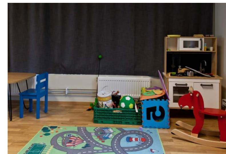
I Trondheim fengsel har barn og familier fått et stort besøksrom med plass til både lek og samtaler. Det er også knyttet et uteareal til barne- og familierommet som kan benyttes under besøkene.

FFP Trøndelag har i 2021 hatt samarbeidsmøter med Verdal og Trondheim fengsel, avd. Nermarka. FFP Trøndelag startet i 2021 arbeidet med et tilbud om familiesamtaler i Trondheim fengsel, støttet av Trøndelag Fylkeskommune. I tillegg til de fysiske møtene har FFP Trøndelag hatt digitale møter med Fauske, Mosjøen, Bodø og Tromsø fengsel.