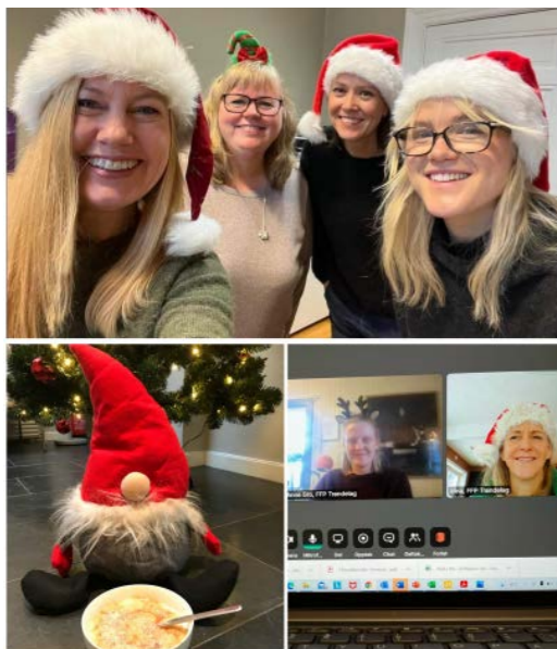
Hyggelig digital advents-markering med FFPs ansatte fra begge avdelinger.

I tillegg til arbeidsgruppa i Oslo har Younes Moe i flere år vært engasjert i aktivitetene til FFP Ung. FFP har også i 2021 gitt pårørende tilbud om individuell terapi hos gestaltterapeut Lill Hallbäck.