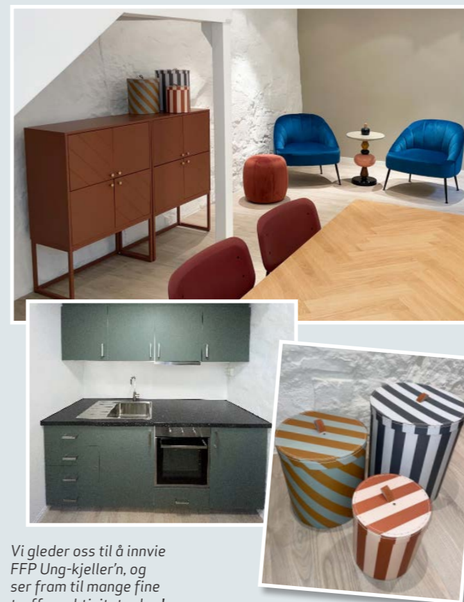
Vi gleder oss til å innvie FFP Ung-kjeller'n, og ser fram til mange fine treff og aktiviteter her!

FFP fikk i 2021 midler fra Vernelagsstiftelsen for å pusse kjelleren i FFPs lokale. Kjelleren framstår som en egen enhet med toalett og kjøkken, og er godt egnet for FFPs barne- og ungdomstilbud, FFP Ung. Oppussingen har blant annet bestått i å legge nytt gulv med varme, ny kjøkkeninnredning og innkjøpe av nye møbler. Vi er svært glade for at vi gjennom tilskuddet nå kan tilrettelegge for et hyggelig møtested for barn og unge som har et familiemedlem som gjennomfører straff. Tusen takk til Vernelagsstiftelsen!