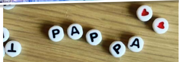
Kitty og Marte er klare for å møte barn og unge fra FFP Ung på nettreff. På treffet ble det perlet fine armbånd.