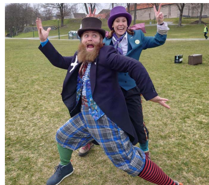
Flying Seagulls spredte stor glede blant barna på aktivitet i FFP Trøndelag.

FFP Trøndelag har hatt tilbud om rådgivning på telefon, e-post, chat, nettsamtaler, individuelle samtaler i lokalene eller ute mens vi går tur, og familiesamtaler med rådgiver og familieterapeut. Vi har tilbudt kulturelle opplevelser og ulike aktiviteter for pårørende.