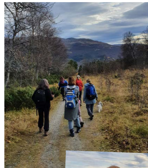
Frisk fjellluft og gode samtaler på helgetur i Oppdal.

I høstferien inviterte FFP Trøndelag pårørende med på helgetur til Oppdal. Vi bodde i koselige hytter på Vekve hyttetun, og arrangerte tur i skogen med grilling og fjelltur i nydelig høstvær med påfølgende middag på restaurant. Det ble også tid til brettspill, gode samtaler og en kafétur.