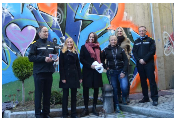
Åpningen av besøkshagen i Oslo fengsel ble høytidelig markert.

I 2021 har FFP i Oslo hatt samarbeidsmøte med Agder fengsel, Froland avd., samt Halden og Oslo fengsel. FFP deltok også på et digitalt aspirantkurs ved Ringerike fengsel, og for innsatte i Eidsberg fengsel holdt vi et foredrag om FFP og familiens situasjon når en i familien sitter i fengsel. FFP deltok i oktober på åpning av ny besøkshage i Oslo fengsel, der innsatte gjennom deltakelse i anleggsgartnerkurs i regi av NAV hadde oppgradert besøkshagen til glede for innsatte og besøkende. I desember deltok vi på servicetorg for innsatte i Bredtveit fengsel, der vi holdt et innlegg om FFPs arbeid. FFP har også hatt kontakt med blant annet Bredtveit og Oslo fengsel gjennom ulike digitale møter.