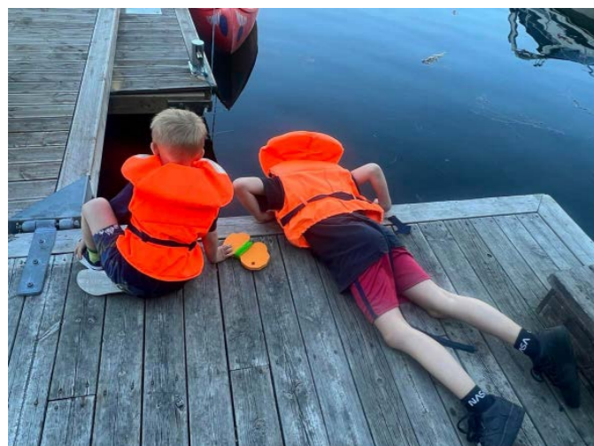
Herlige dager på ferietur for pårørende til Kragerø.

FFP Ung i Oslo har gjennomført følgende aktiviteter i 2022: Kino og burger, Albert Åberg på teater, bowling og pizza, sommerferietur til Kragerø, indoor skydive, åpningsfest i FFP ung-kjeller'n, Tusenfryd, pizza og klatring, kino, Rush trampolinepark, juleverksted og teaterforestillingen Snøfall på Oslo Nye Teater