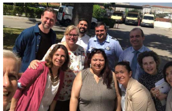
Utenfor fengselet i Coimbra med fengselsleder, Caspae og deltakere i 3C prosjekt.

I 2022 besøkte vi Caspae i Portugal og de besøkte FFP i Oslo. I Portugal deltok vi blant annet i en workshop hvor alle representanter presenterte en case fra eget arbeid. Det var et stort engasjement med spørsmål, kunnskapsdeling fra egen praksis, refleksjon og interessante diskusjoner. Under Caspae's besøk i Norge, besøkte vi både Bredtveit og Halden fengsel for å snakke med barneansvarlige og se hvordan besøksavdelinger og besøksbus kan tilrettelegges. Vi hadde også et møte med Barnevernvakten i Oslo der vi blant annet fikk høre om politiet og Barnevernvaktens samarbeid rundt barn under både planlagte og ikke planlagte pågripelser av omsorgspersoner. Vi besøkte også Myrnsnipa Samværsted, et tiltak under Kirkens Bymisjon som legger til rette for samvær med tilsyn mellom barn og deres foreldre.