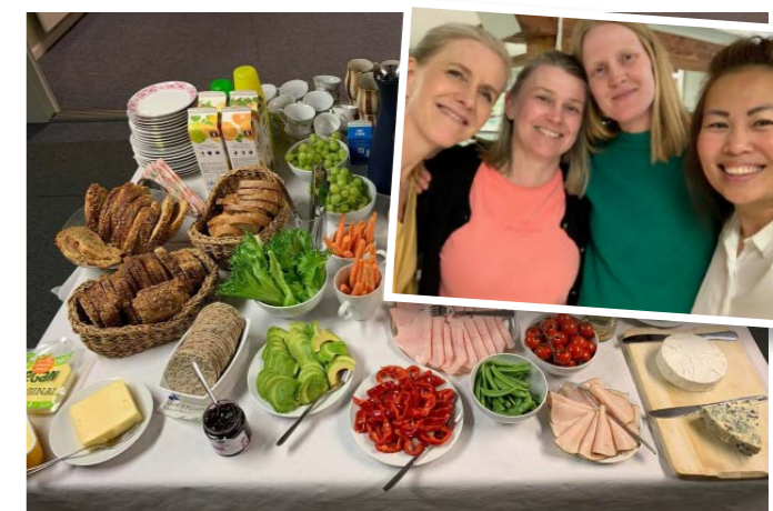
Etter to års opphold på grunn av koronapandemien kunne FFP Trøndelag igjen invitere til den årlige samarbeidslunsjen.