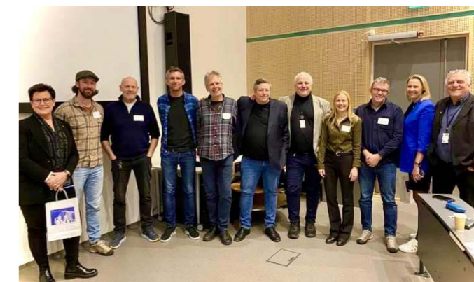
To fine og innholdsrike dager på Kriminalomsorgens høgskole og utdanningscenter KRUS med fokus på samarbeidet mellom Kriminalomsorgen og de frivillige organisasjonene.

Sammen med organisasjonene Wayback, FRI Vestfold og Røde Kors har FFP samarbeidet med KRUS om planlegging og gjennomføring av en todagers fag- og erfaringsamling for frivillige organisasjoner og kriminalomsorgen. FFP bidro med innlegg under temaet «Virker det vi gjør?» Det var bl.a. også innlegg fra kriminalomsorgen om betydningen av de frivillige, og det var panelsamtale med organisasjoner og politikere om finansiering og rammevilkår for de frivillige organisasjonene.