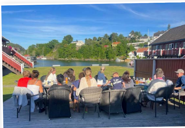
Fint å møte andre pårørende til gode samtaler og hyggelige opplevelser gjennom FFPs tilbud.