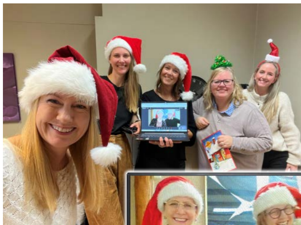
Hyggelig førjulstradisjon der ansatte i FFP starter adventstida med julelys, pepperkaker og julesang.