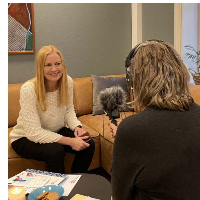
Hanne fra FFP ble intervjuet av Røverradion i en fin podkast-episode om pårørendes situasjon.