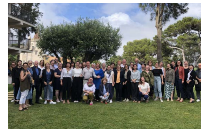
COPEs deltakere fra mange land i Europa samlet på årets konferanse

FFP er med i det europeiske nettverket Children of Prisoners Europe (COPE) som består av organisasjoner i mange europeiske land som arbeider for barn med foreldre i fengsel, og i det skandinaviske nettverket 24 timer for barn av innsatte . Det var ingen samling i det skandinaviske nettverket i 2022, men FFP deltok på konferanse, generalforsamling og nettverksmøte i COPE i Cascais i Portugal i juni.