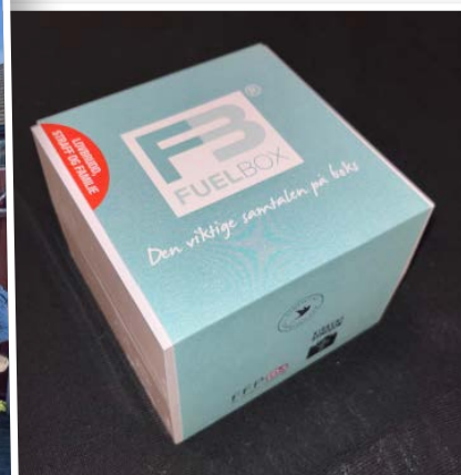
I samarbeid med Kirkens Bymisjon har FFP utviklet samtalevektøyet Fuelbox lovbrudd, straff og familie