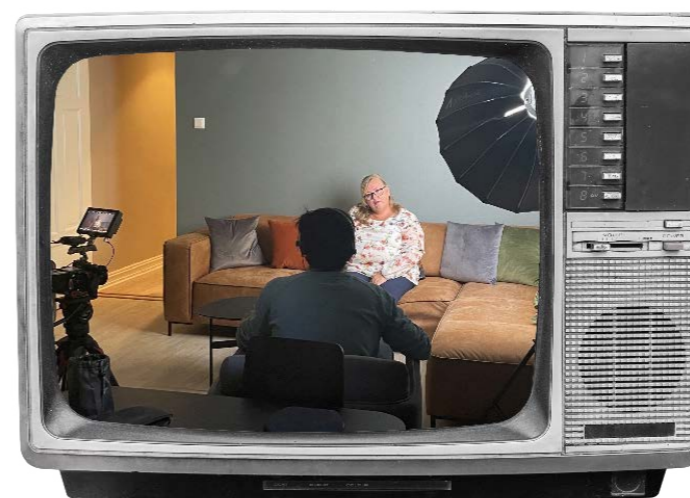
Bente fra FFP ble intervjuet av Portugisisk TV om det europeiske samarbeidet om barn med foreldre i fengsel.

Også i 2022 har FFPs utstilling Bak murene – sett med barn av innsattes øyne vært vist på Justismuseet i Trondheim. Utstillingen består av bilder tatt av tre ungdommer på 15 og 16 år med en forelder i fengsel på Ullersmo fengsel våren 2015. Justismuseet er Norges nasjonale museum for justissektoren. FFPs utstilling har vært vist på museet siden 2021.