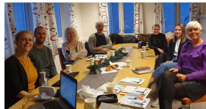
På dag to av turen til Tromsø hadde vi et informasjonsmøte om FFP for samarbeidspartnere hvor både ansatte fra Tromsø kommune, Gatejuristen Tromsø, Konfliktrådet og Utekontakten i Tromsø var til stede.

FFP Trøndelag var i Tromsø i desember, der vi hadde tilbud om samtaler med pårørende og var ute og spiste middag sammen på kvelden. I samarbeid med Tromsø fengsel arrangerte FFP også en vellykket pårørendedag. Pårørende fikk omvisning i fengselet og mulighet til å stille ansatte i fengselet spørsmål rundt soning.