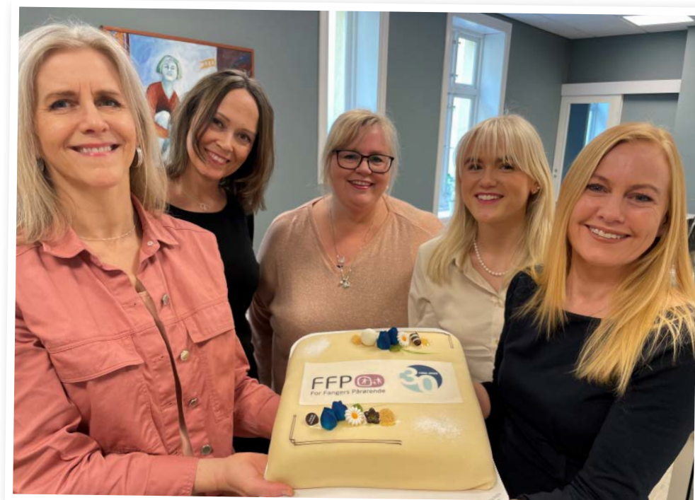
I 2022 ble FFP 30 år! Jubileet ble feiret på FFPs årsmøte, med jubileumskonferansen «Pårørendes stemme» og med en jubileumsmiddag for pårørende.