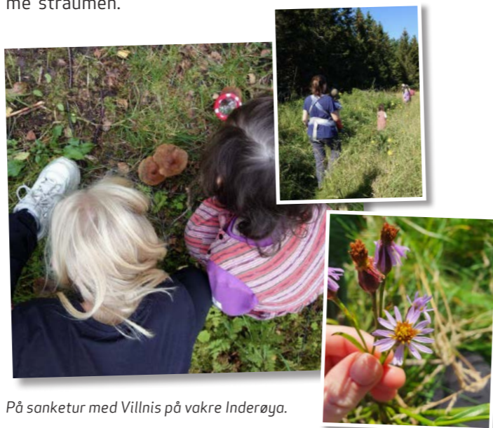
På sanketur med Villnis på vakre Inderøya.