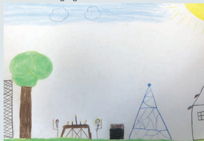
Tegningene barna tegnet var inspirert av Europarådets anbefalinger om barn med foreldre i fengsel. En av anbefalingene barna tegnet til, var at det bør være mulig å få besøke utendørs slik at man kan være sammen på en mer naturlig måte.

FFPs Hjerte for barna- aksjon er et årlig innslag i kampanjen Not my Crime, Still my Sentence som arrangeres av COPE – Children of Prisoner Europe. FFP sender vanligvis brosjyrer formet som et vaffelhjerte til alle fengslene med oppfordring om å ha fokus på barn og barns rettigheter gjennom hele året, og å steke vafler eller gjøre noe annet hyggelig for barn på besøk i kampanjeperioden. I 2020 var dessverre besøksavdelingene helt eller delvis stengt under kampanjeperioden i juni, og kampanjen ble derfor omgjort til tegneworkshop om Europarådets anbefalinger om barn med foreldre i fengsel. Barna tegnet tegninger til den anbefalingen som var viktigst for nettopp dem. Tegneverkstedet foregikk både fysisk hos FFP i Oslo og digitalt.