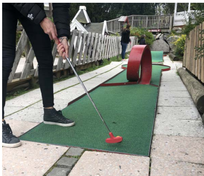
En morsom dag for både små og store med minigolf og pizza på Ekeberg!

FFP i Oslo gjennomførte noen aktiviteter i FFP Ung med fysiske treff i 2020, noen før koronapandemien startet og noen underveis når smittesituasjonen tillot det. Vi hadde gokart for aldersgruppen 13-18, tegneworkshop, kreativt verksted med keramikk på Glazed & Amused, minigolf og pizza på Ekeberg. I år var det ikke tilrådelig med samling av store grupper til for eksempel felles lunsj på Tusenfryd, så vi delte ut billetter til familier slik at de kunne dra en dag det passet for dem. En planlagt felles kinotur ble av samme årsak omgjort til at familiene fikk kinogavekort og dro på kino hver for seg. Vi har gjennomført flere digitale treff for barn og unge med Kahoot, Casino og utdeling av fine premier, og vi har delt ut flere kinogavekort.