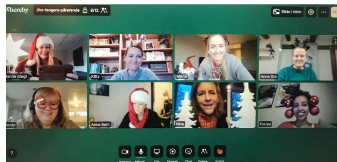
Det gjelder å gjøre det beste ut av situasjonen! Her møtes de ansatte i FFP til juleavslutning.