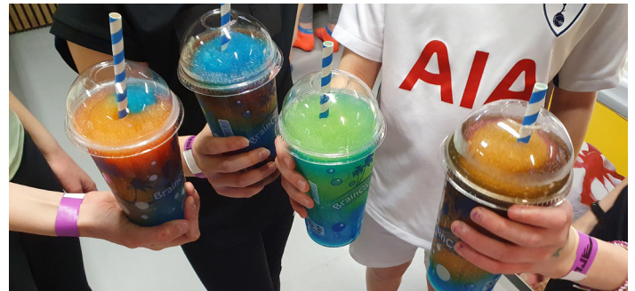
Det ble noen fine møter mellom trampolinene, og helt nødvendig med påfyll av drikke og energi etter så mye aktivitet!

«Ååh, det var så godt å le! Og jeg hadde ikke bekymringstanker for sønnen min en eneste gang under showet.» Det var mange smil og trim av lattermuskler da FFP inviterte pårørende på Lat-tergalla i begynnelsen av februar. I januar var FFP Trøndelag på RUSH trampolinpark med en gjeng store og små pårørende. FFP er godt i gang med semesteret, og våren byr på mange muligheter til å treffe andre pårørende og oss som jobber i FFP. Se baksiden for vårens program.