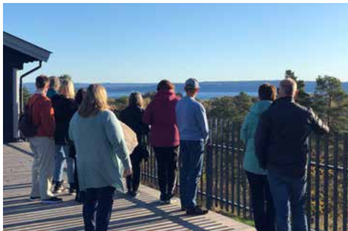
Mange syntes det var godt å kunne være sammen og dele erfaringer i de vakre omgivelsene på Leangkollen hotell.

“Sønnen min har gjort fæle ting, men jeg er mammaen hans. Jeg fordømmer det han har gjort, men med dere får jeg «lov» til å være mamma og glad i han også.”