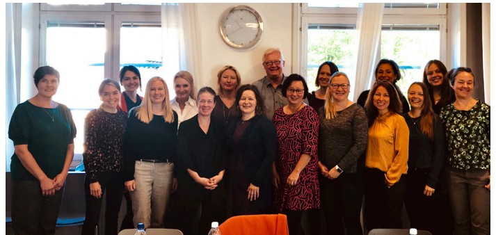
I 24 timer delte engasjerte deltakere fra Sverige, Danmark, Finland og Norge erfaringer fra arbeid for barn av innsatte.

I år møttes nettverket for sjette gang, denne gang i Stockholm. Temaet var barnekonvensjonen og Europarådets anbefalinger fra 2018, for ivaretagelse av barn som har foreldre i fengsel. Barn har grunnleggende rettigheter når det gjelder kontakt med sine foreldre. Det er viktig at Kriminalomsorgen legger til rette for at disse rettighetene innfris. Samtidig er det viktig at organisasjonene og barneombudene jobber for å påvirke, slik at barns beste alltid skal legges til grunn i saker som gjelder barna.