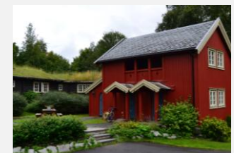
Vekve hyttetun ligger sentralt til i Oppdal sentrum.

Bli med på fellesaktiviteter, kos deg i svømmehallen eller gå en tur i fjellet! Se mer informasjon på www.ffp.no