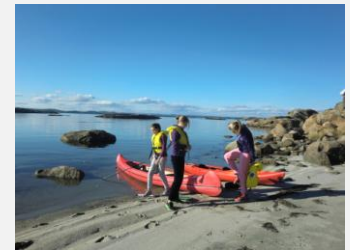
Padling i nydelige omgivelser, fra fjorårets tur til Heia Eidene.

På Eidene blir det hyggelig samvær og aktiviteter som fjellklatring, rappeling, linevandring og taubane.