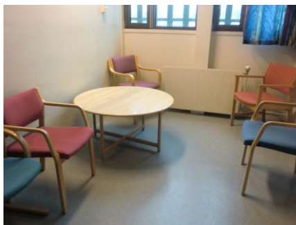
Familierommet før oppussing...

Drammen fengsel har pusset opp familiebesøksrommet. FFP ble invitert til fengselet i april for å komme med innspill før oppussingen. Det hadde skjedd en stor forbedring da vi var der igjen i august! Flott initiativ og bra gjennomført av ansatte i Drammen fengsel! Friske farger, nye møbler og leker gjør at rommet nå fremstår som mye hyggeligere enn tidligere, både for voksne og barn. Det å opprettholde god kontakt når et familiemedlem sitter i fengsel kan være en utfordring. Hyggelige besøksrom er viktig for å gjøre besøk i fengsel til en best mulig opplevelse!