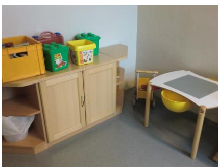
Barnekroken før oppussing.