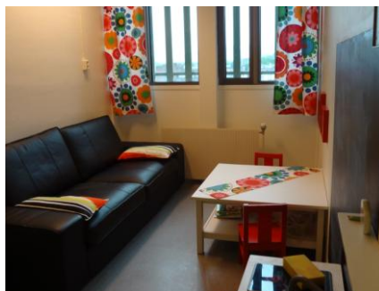
...og slik ser det ut nå. Stor forbedring!