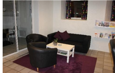
Våre lokaler i Fjordgata 19

Påmelding til aktivitetene per telefon, sms eller e-post.